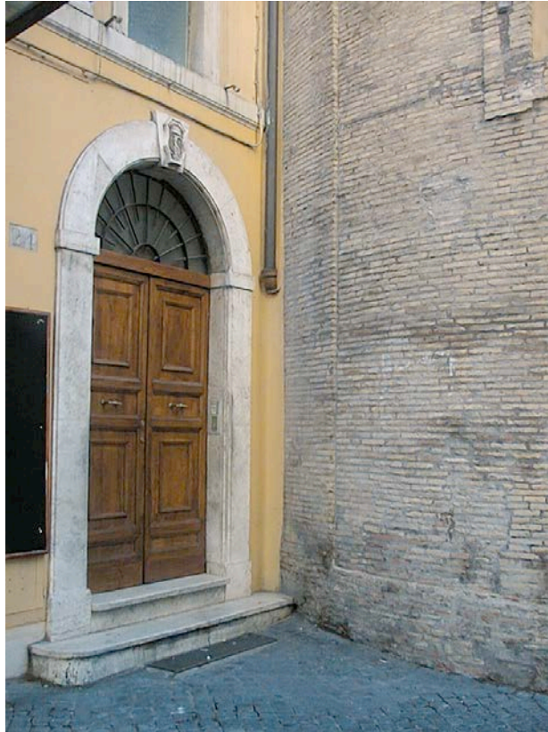
la parrocchia di santa maria in via fino da allora